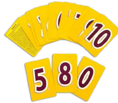
MEMORIA 10 $40