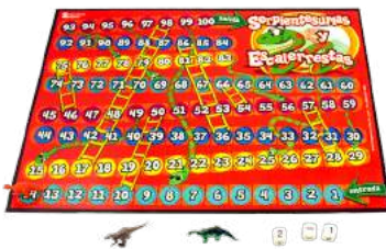
SERPIENTES Y ESCALERAS $130