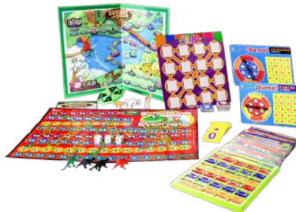
PAQUETE PRIMARIA BAJA CÁLCULO MENTAL $640