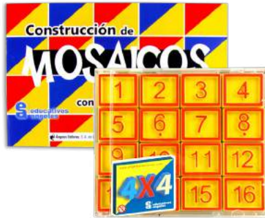
4x4 CON FOLLETO MOSAICOS $190