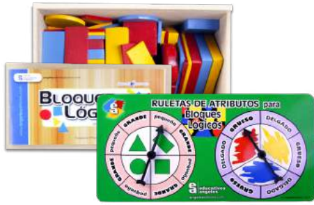
BLOQUES LÓGICOS CON RULETAS DE ATRIBUTOS $300