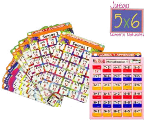
5x6 CON 16 TARJETAS $200