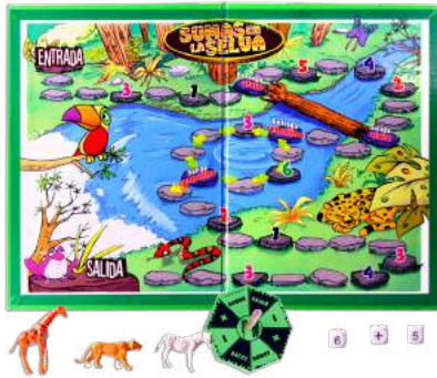
SUMAS EN LA SELVA $140