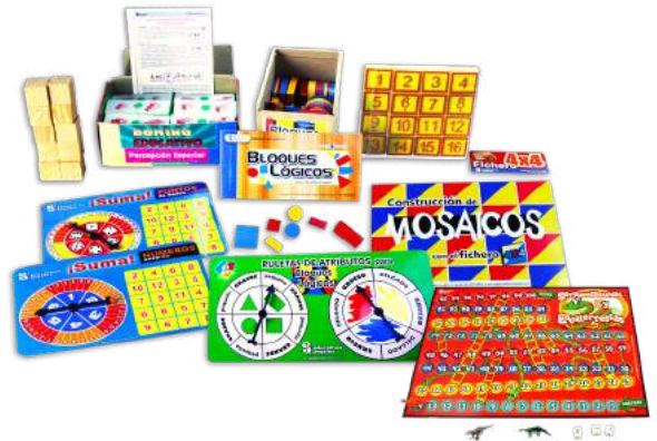
PAQUETE PREESCOLAR $900