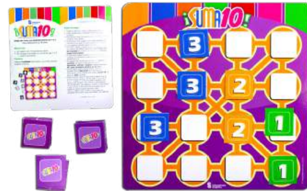
¡SUMA 10! $90