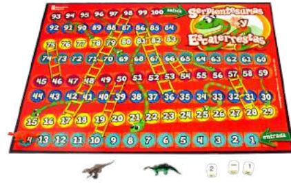
SERPIENTES SUSMAS Y ESCALERRESTAS $130