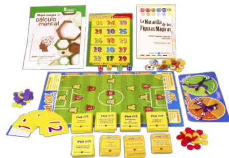
PAQUETE SECUNDARIA CÁLCULO MENTAL $750