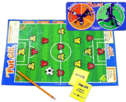
SUPER FUT-GOL CON 8 TARJETEROS $420