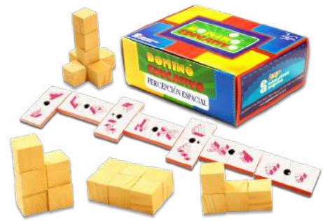
DOMINÓ PERCEPCIÓN ESPACIAL CON CUBOS $200