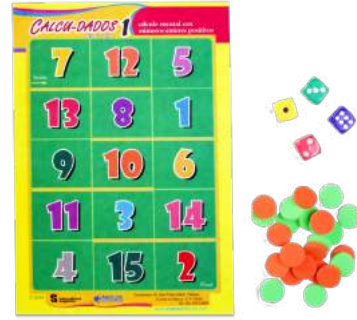
CALCUDADOS 1 $90