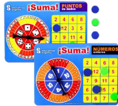
2 RULETAS DE SUMAS $80