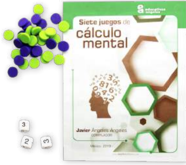
SIETE JUEGOS DE CÁLCULO MENTAL $100