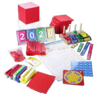
PAQUETE BASE 10 $860