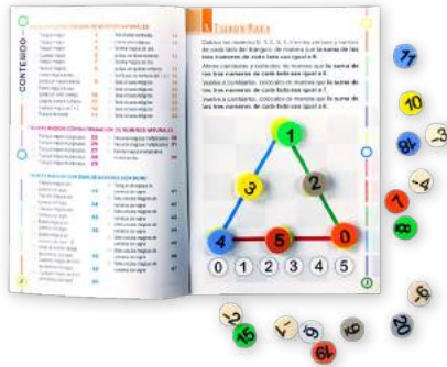
LA MARAVILLA DE LAS FIGURAS MÁGICAS $100